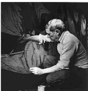
Nella foto di Dora Maar, Pablo Picasso mentre dipinge Guernica . Parigi, 1937.