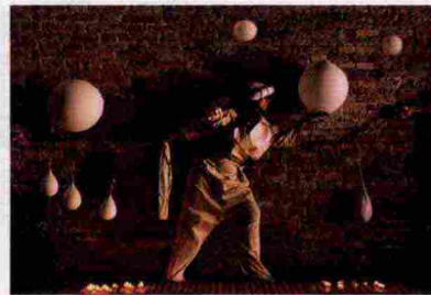
Nidaa Baldwin/Courtesy /Artista e Galleria Fumagalli

immagini diventano terapia, rifugio catartico agli orrori del mondo. La mostra Rinascita (sotto, Rinascita 10 ) racconta questo percorso necessario; galleriafumagalli.com ●▲